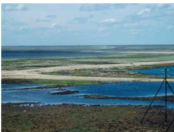
Хулым. Вид на юг.

Необъятные просторы тайги, самобытность провинциальных северных городов, великие империи нефтяного промысла – все это Вы можете увидеть на фотографиях, предоставленных сервисными инженерами «НГ-Энерго» и посвященных географии наших работ.