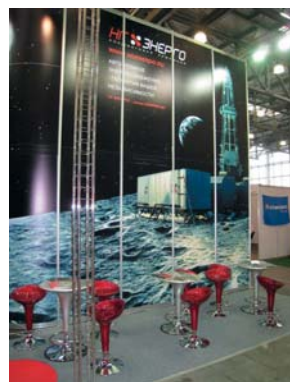
Выставка в Санкт-Петербурге «РосГазЭкспо-2008»