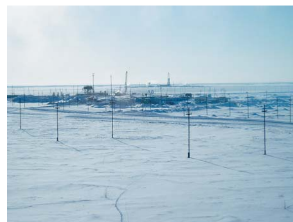
Хулым. Зимний вид на восток.