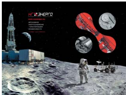
Выставка в Москве «MiningWorldRussia - 2008»

Итак, информативность и образность, доводы и креатив: смешиваем, солим, перчим, наконец, улыбаемся – перед Вами, уважаемые потенциальные заказчики, наши незабываемые интригующие стенды на выставках и вкупе с ними, замечательная работа менеджеров отдела продаж.