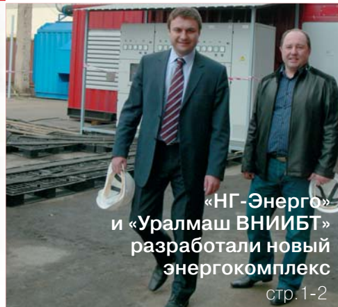
«НГ-Энерго» и «Уралмаш ВНИИБТ» разработали новый энергокомплекс стр. 1-2