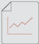
Разработка ТЭО и инвест моделей

ООО «НГ-Энерго» специализируется на инжиниринге, производстве, строительстве и сервисе энергетических объектов нефтегазодобычи, бурения, горнодобывающих компаний и объектов инфраструктуры. Компания делает акцент на реализации комплексных решений по обеспечению заказчиков электрической и тепловой энергией. При этом выполняется весь необходимый комплекс работ.