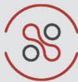
Аренда и эксплуатация электростанций