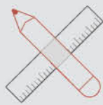
Проектное обследование Проектирование